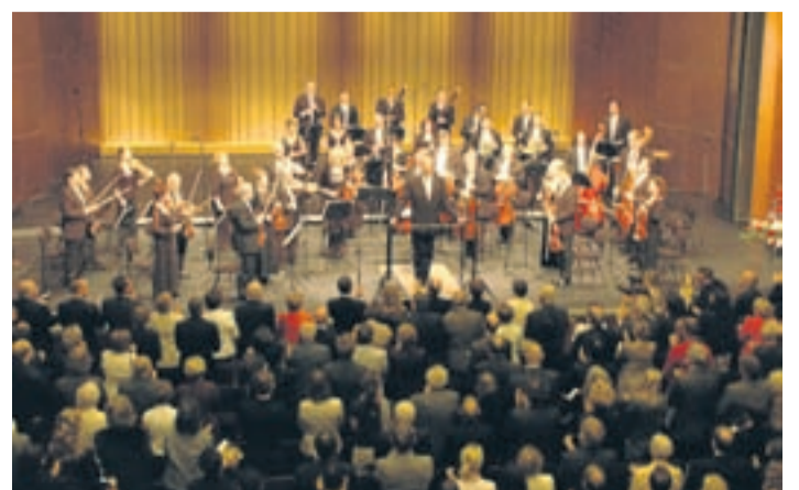
Auch beim Konzert des Israel Chamber Orchestra in der Stadthalle waren viele junge Zuhörer dabei. Einige durften sogar zur Pressekonferenz im Vorfeld.

i Ein Blick hinter die Kulissen ist noch möglich beim Konzert „Zwei Klaviere und Live-Elektronik“ mit den Gebrüdern Kutrowatz am Dienstag, 16. August, um 19.30 Uhr, in der Stadthalle. Interessierte Jugendliche (ab 8. Klasse) sollten sich schnellstmöglich mit einem kleinen Motivationsschreiben per E-Mail bewerben: maria.saulich@stadt.bayreuth.de.