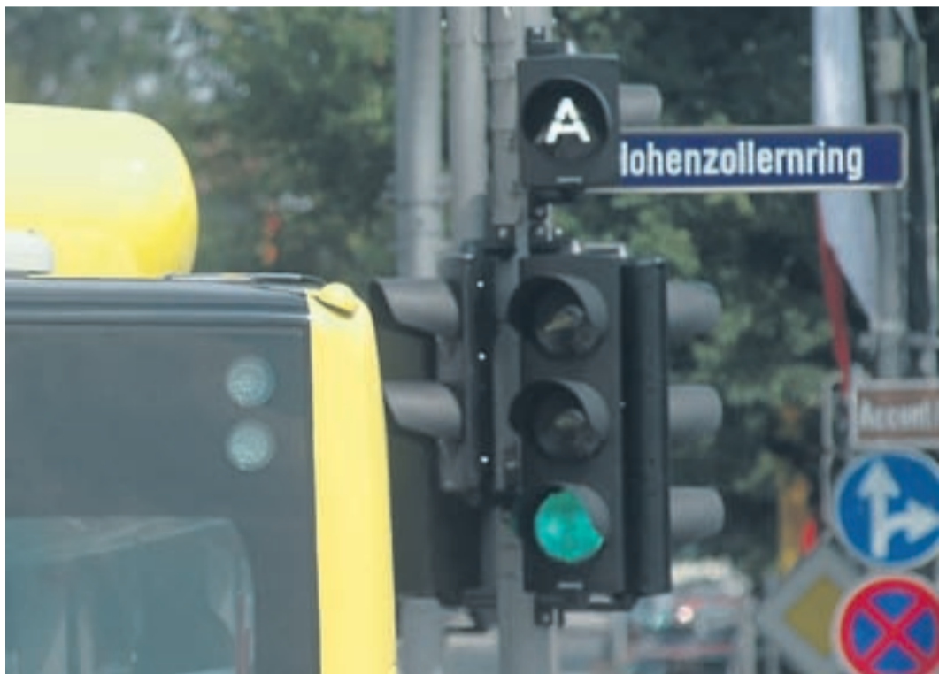
Das A oberhalb der Ampel signalisiert, dass die Ampel den Bus erkannt hat. Meldet dieser eine Verspätung, wird er bevorzugt.

Insgesamt 2,4 Millionen Euro haben die Stadt Bayreuth und die Bayreuther Verkehrs- und Bäder- GmbH (BVB) gemeinsam in die Busbeschleunigung investiert, kofinanziert mit Fördergeldern des Freistaates Bayern. Der Löwenanteil fällt dabei auf die neuen Ampeln, ein kleinerer Teil floss in die neuen