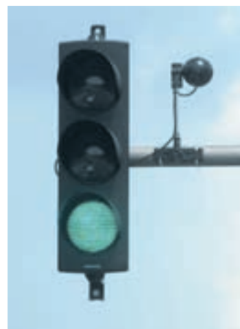
Die neuen LED-Signale verbrauchen deutlich weniger Energie.

Im Zuge der Busbeschleunigung wurden darüber hinaus auch Vorteile für andere Verkehrsteilnehmer geschaffen: Detektoren und Induktionsschleifen im Boden sorgen abhängig vom Verkehrsaufkommen speziell in Seitenstraßen für grüne Ampeln – wichtig ist hierbei allerdings, dass die Autos bis an die Haltelinie fahren, um von den Induktionsschleifen „erkannt“ zu werden. Die neu eingerichteten Anforderungstaster für Fußgänger sorgen für längeres Grün beim Überqueren der Straße. Will kein Fußgänger über die Ampel, so hat der fahrende Verkehr längere Grünphasen.