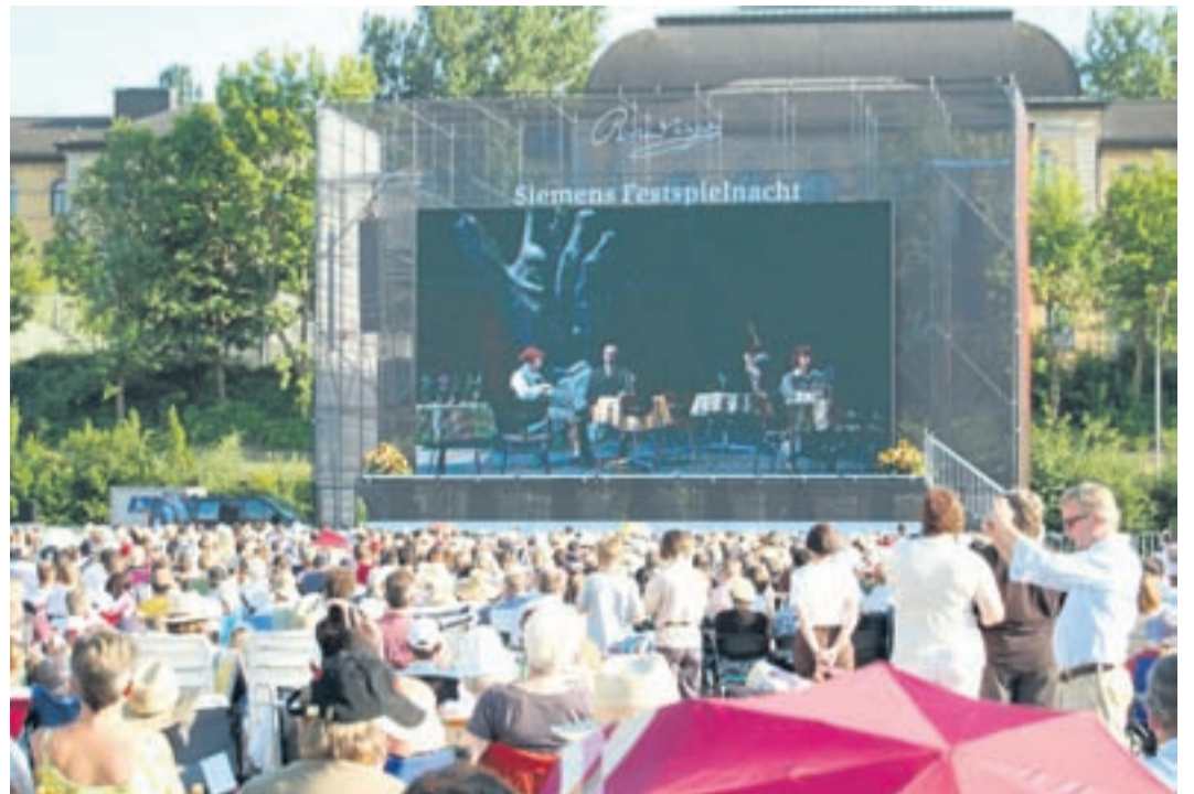
Zehntausende Besucher werden erwartet, wenn bei der Siemens Festspielnacht am kommenden Sonntag „Lohengrin“ live aus dem Festspielhaus auf den Volksfestplatz übertragen wird.

Veranstalter des 4. Richard-Wagner-Public Viewings ist die Bayreuth Marketing & Tourismus GmbH in Zusammenarbeit mit der Bayreuther Festspiele Medien GmbH. Die Veranstaltung wird wie in den vergangenen Jahren großzügig gefördert von der Siemens Stiftung.