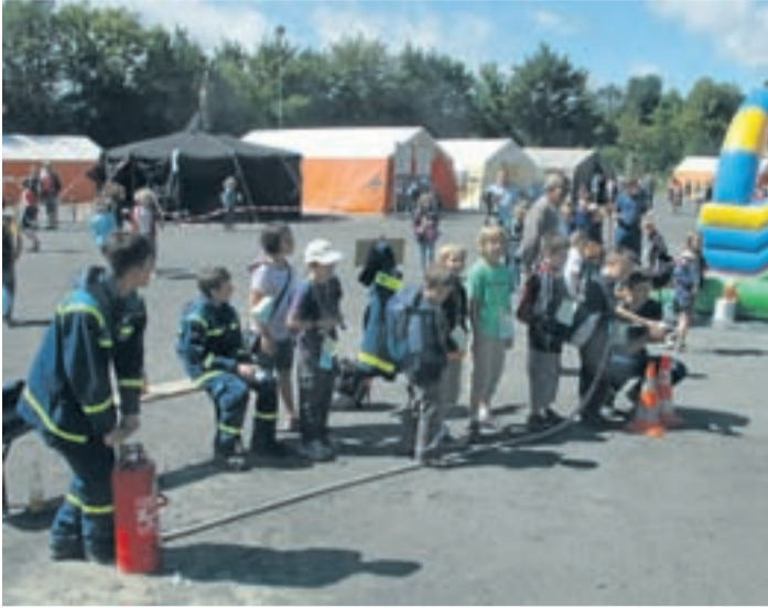
Wie immer lockte auch in diesem Jahr die Zeltstadt Mini-Bayreuth viele Kinder und Jugendliche auf das Gelände des SC Kreuz.

„Wir haben auch in diesem Jahr festgestellt, dass wir genau das anbieten, was die Kids wollen“, so Krodel. Das Sommerferienprogramm mit seinen insgesamt 119 Angeboten ist so breit aufgestellt, dass wirklich für jeden etwas dabei ist. „Es freut uns natürlich besonders, wenn wir positive Rückmeldungen bekommen“, betont Krodel. In diesem Jahr zeigten sich einige neu zugezogene Eltern vom Angebot und dem Anmeldeverfahren richtiggehend begeistert. In anderen Städten scheint das anders zu laufen.