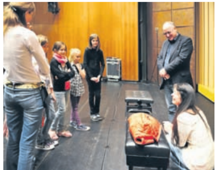
Zeit für Fragen: Alice Sara Ott (rechts) nahm sich Zeit für die Nachwuchspianisten und beantwortete ihre Fragen.